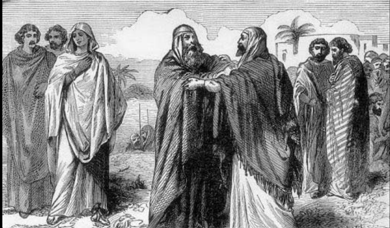
Exodus 18 – Jetro geeft Mozes raad